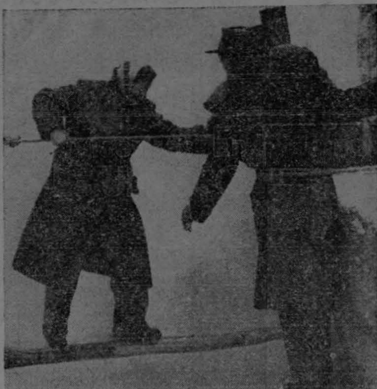
Ayudándose con una reata tendida a través de un río y pisando la débil consistencia de un tronco, una mujer húngara cruza la línea divisoria de Hungría y Austria, para refugiarse en la libertad, después de haber apelado a todos los medios para escapar del terror comunista, cuyos dirigentes habían cortado todas las carreteras y puentes que unían a los dos países.