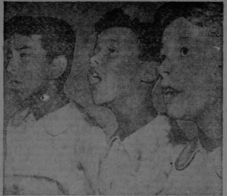
Tres de los niños que integran el grupo de Cantores de Morelia