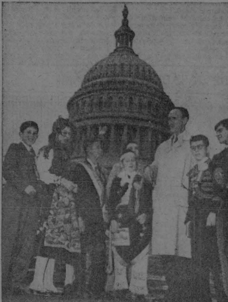
Recientemente se reunieron en la ciudad de Washington, niños de las más diversas naciones del mundo, que acudieron como embajadores de buena voluntad, para simbolizar la amistad que debe existir entre todos los seres de la Tierra. En el grupo fotografiado frente al Capitolio, aparece, a la derecha, el niño representante de México.