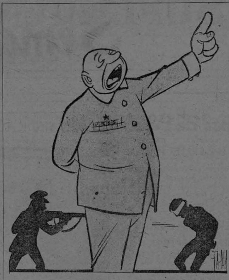
Se está "extinguendo" el anticomunismo en Hungría De "Ultimas Noticias", de la ciudad de México.