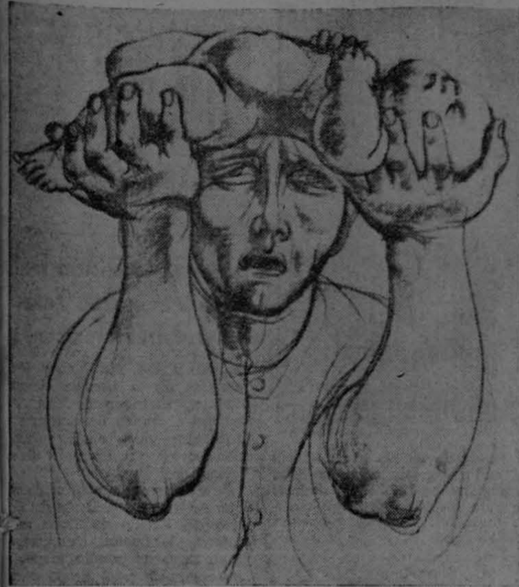
Figura de la madre húngara que eleva sobre su cabeza el cadáver del hijo muerto por la metralla de los tanques soviéticos, en Budapest, obra del pintor suizo Hans Erni

"Los tanques han destruido mi fe y he aprendido una lección de ellos, en nombre de la libertad". Estas fueron las palabras pronunciadas por el extraordinario pintor y diseñador suizo, Hans Erni, quien perteneció al Partido Comunista y ha roto su asociación con los totalitarios soviéticos, como consecuencia de